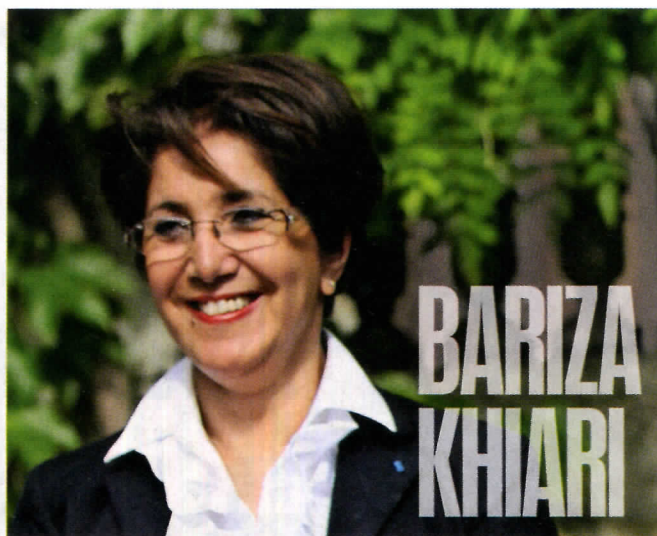
Selon la sénatrice PS de Paris, l'islam ne se résume pas aux quartiers. Elle estime que « quelque chose est en train de naître ».

de l'appel veulent croire, à l'image de Bariza Khiari, sénatrice PS de Paris, que « quelque chose est en train de naître ». Les sceptiques diront que ces fantassins pleins d'allant ne forment, pour l'heure, qu'une maigre troupe. En réalité, dans tout l'Hexagone, d'autres figures musulmanes à la réussite exemplaire s'engagent déjà à leur échelle. A l'heure où la société française exige des fidèles de l'islam une adhésion explicite aux valeurs républicaines, la mobilisation de ces élites nationales et locales à la flamme laïque fièrement brandie constitue un enjeu important pour l'avenir.