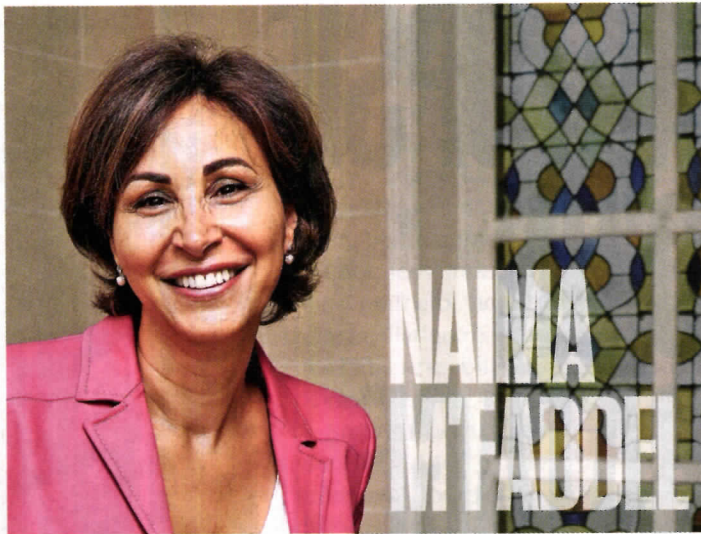
« Même si c'est à nous de nous organiser, je trouve très bien que l'Etat s'en mêle », affirme la déléguée du préfet des Yvelines.

commun entre un Maghrébin et un Subsaharien, sans même parler des origines géographiques différentes ou du degré de pratique, très variable ?