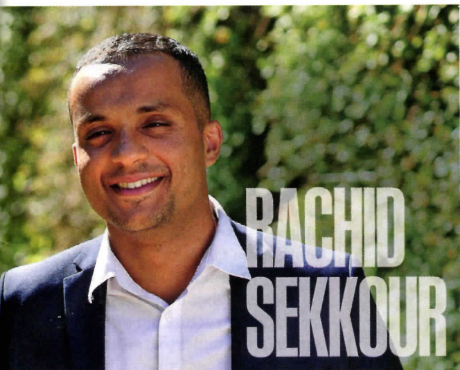
L'adjoint au maire de Vandœuvre-lès-Nancy projette d'ouvrir un centre de lutte contre la radicalisation.