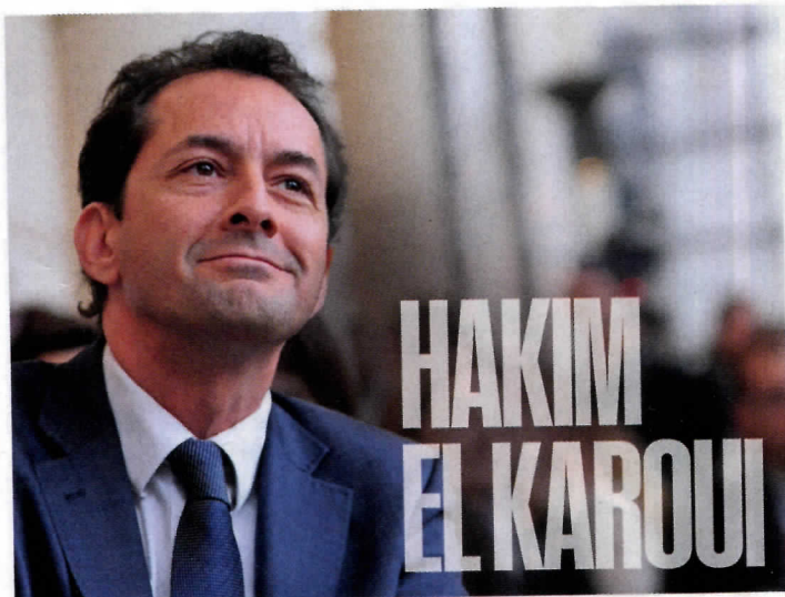
L'ex-conseiller de Jean-Pierre Raffarin a fondé le club xx e Siècle pour promouvoir la diversité dans l'espace public.